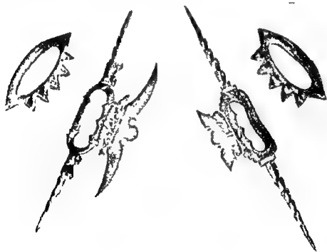
Fig 6 Vajramusti the smaller Vajramustis are for games and the bigger for warfare